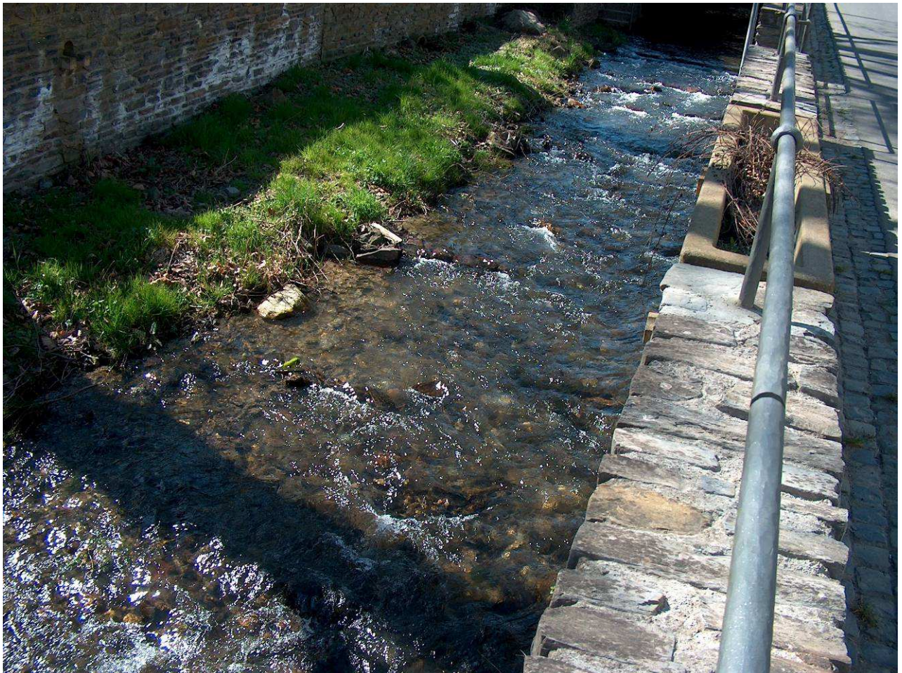
und der lustig plätschernde Frohnbach