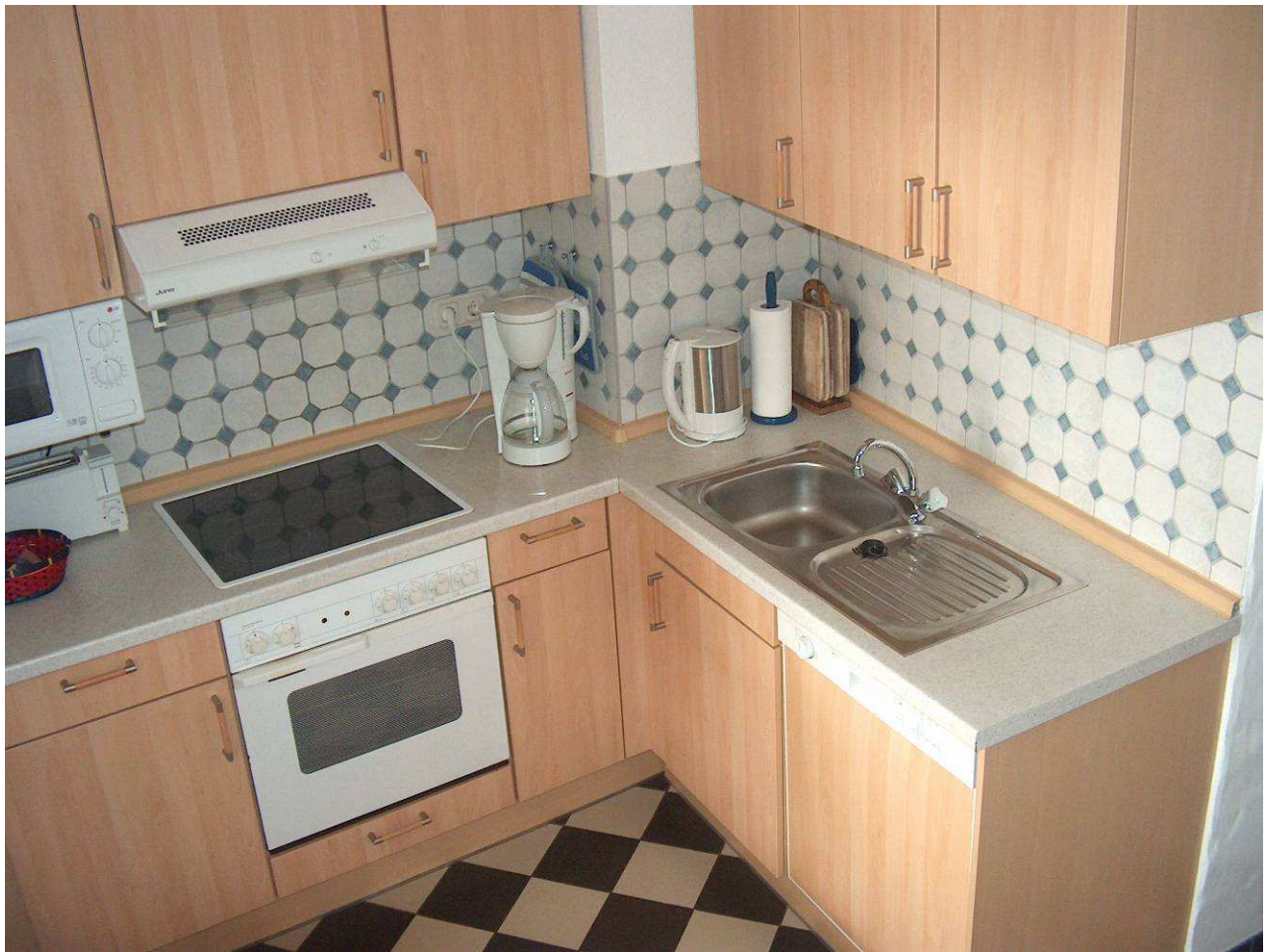
Küchenzeile mit allem Geschirr, Spülmaschine, Mikrowelle etc.