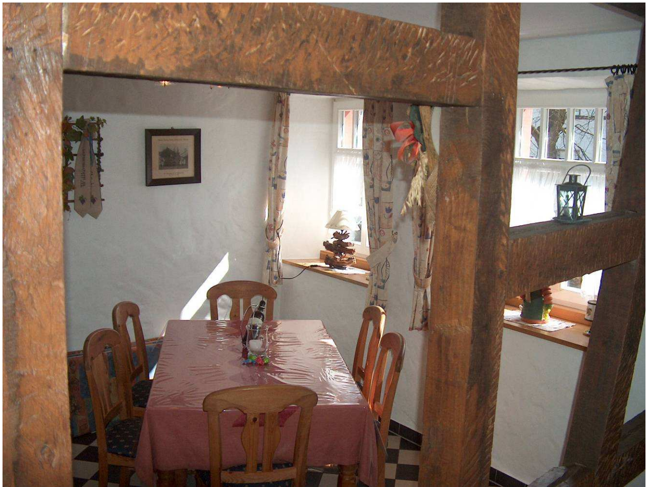
170 Jahre altes perfekt restauriertes Fachwerk