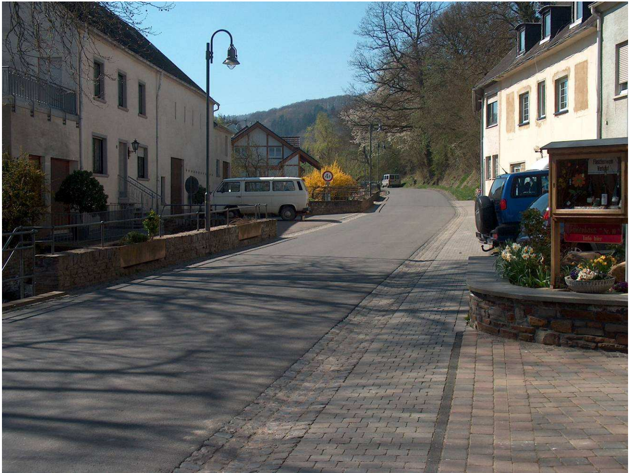
Auf der Straße vor dem Ferienhaus