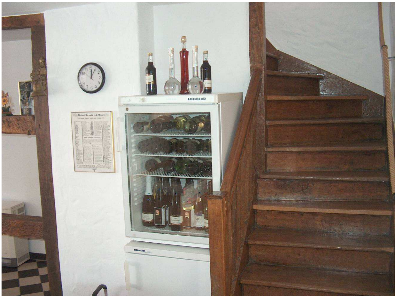
Normaler Kühlschrank mit Eisfach und Flaschenkühlschrank