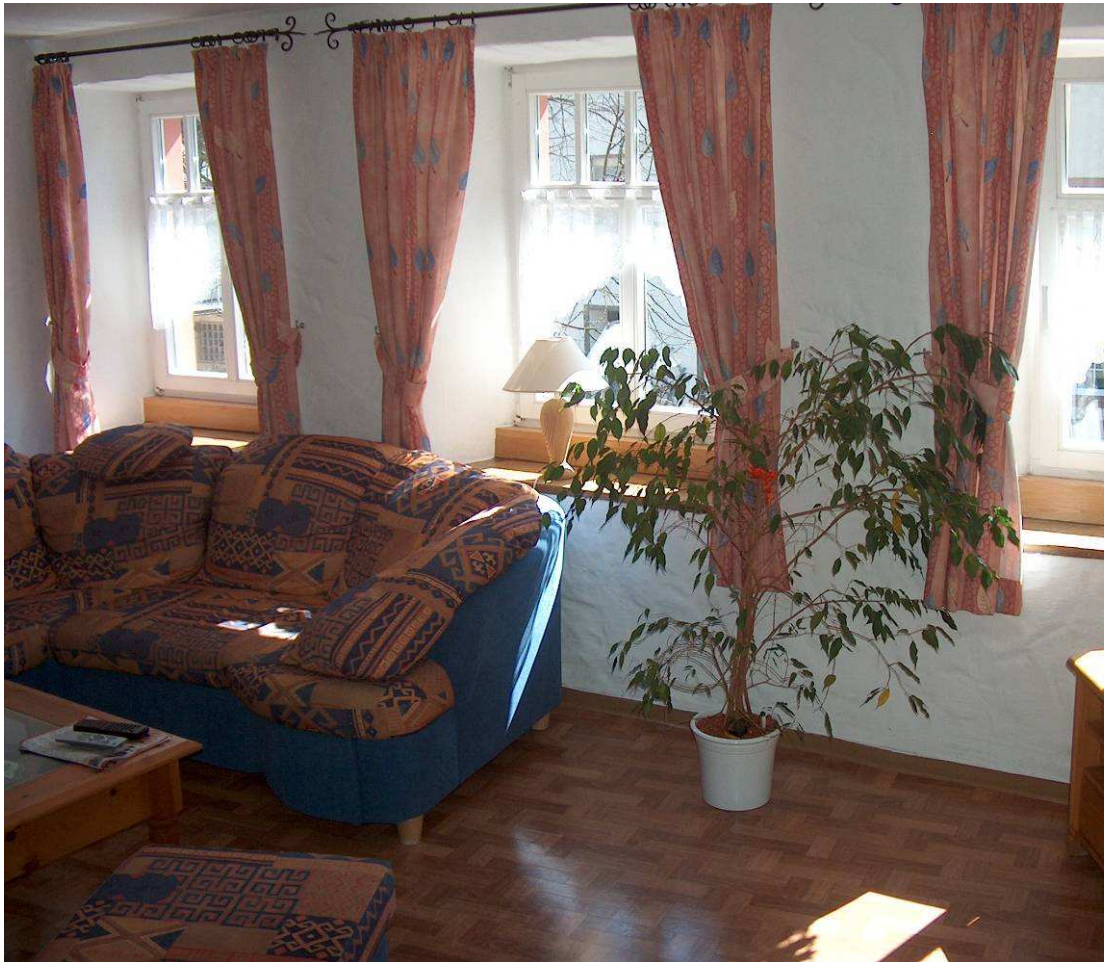
Gemütlicher Wohnraum im OG