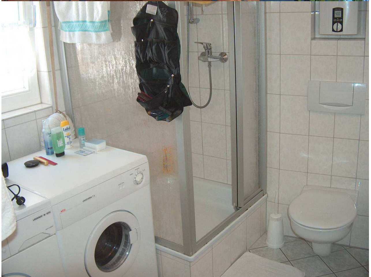
Bad mit Dusche und WC, Waschmaschine und Trockner, zusätzlich separates WC im EG