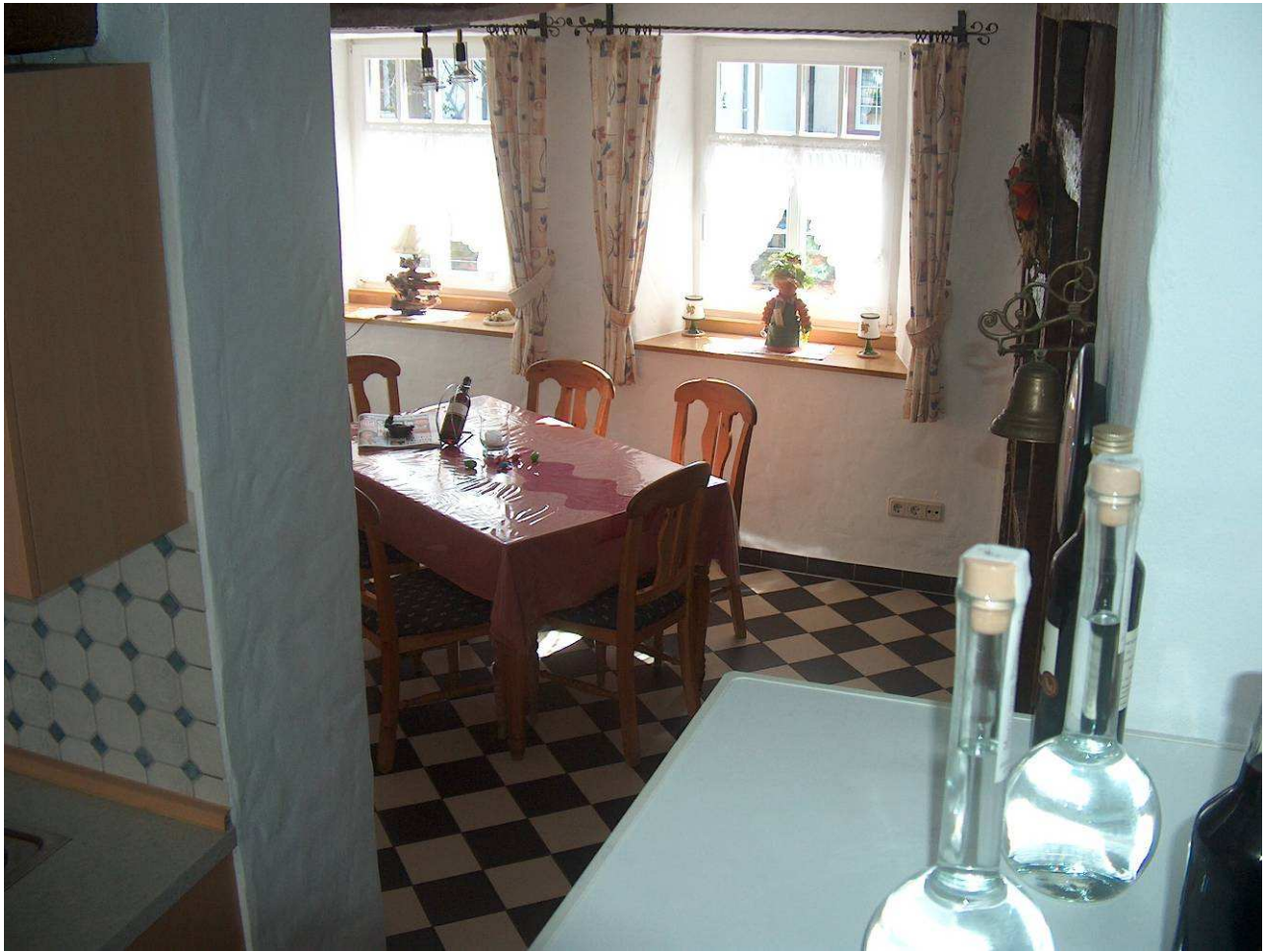
Blick ins Esszimmer